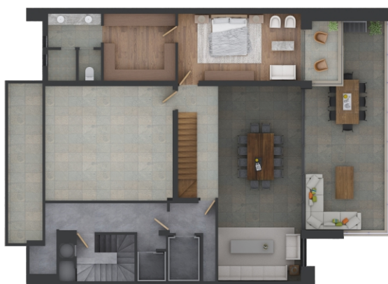
Modelo C (Planta Alta)