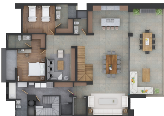
Modelo C (Planta Baja)